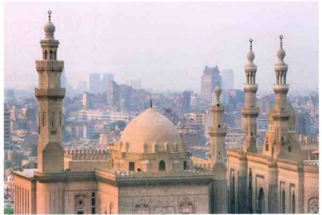
Kanzlerin Angela Merkel traf im März Präsident Abdel Fattah el-Sisi in Kairo. Die Megacity bietet deutschen Firmen viele Chancen.

aus, das gesamte Wachstum zu erklären. Zudem verzeichneten die Sparten Kunststoff- und Gummimaschinen mit 158 Prozent Zuwachs, Textilmaschinen mit 500 Prozent sowie Druck- und Papiertechnik mit 50 außergewöhnliche Zuwachsraten.“ Auch Exporteure von Pumpen, Armaturen, Kompressoren und Verfahrenstechnik verzeichneten ein stärkeres Ägypten-Geschäft. Sie profitierten auch von den hohen Investitionen im Öl-, Gas- und Petrochemiebereich.