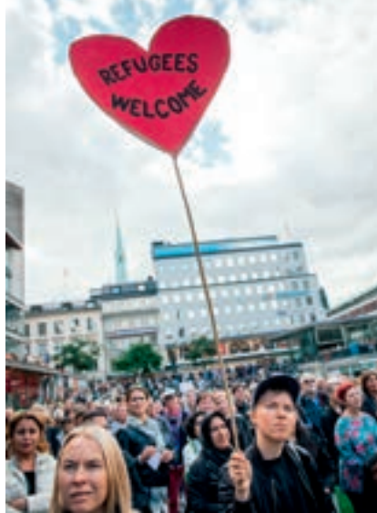
163 000 Flüchtlinge nahm Schweden 2015 auf. Das belebt auch die Wirtschaft.

AHK-Pressesprecher Luthardt sieht zudem gute Möglichkeiten für deutsche Industrieunternehmen, Geschäfte und Kooperationen mit Vertretern der IT-Branche einzugehen. „Das Thema Industrie 4.0 ist auch in Schweden aktuell“, erklärt er. „Hierzulande gibt es Kompetenz, die deutschen Unternehmen bei der Digitalisierung ihrer Herstellungsprozesse helfen kann.“