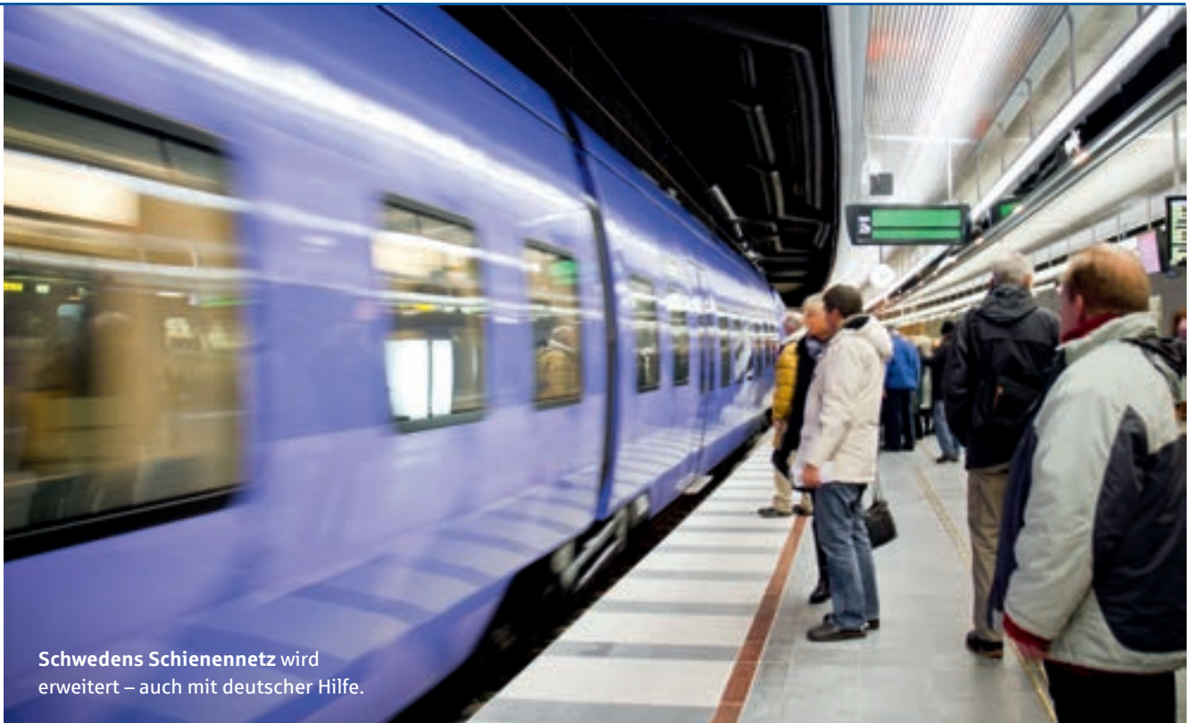
Schwedens Schienennetz wird erweitert – auch mit deutscher Hilfe.