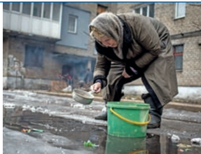
Welt der Gegensätze. In Kiew will man sich weiter von Russland distanzieren. In der besetzten Ostukraine ist die Versorgungslage der Bevölkerung am Boden.

Allerdings sind nicht alle in Russland lokalisierten Firmen so erfolgreich. „Das Thema Protektionismus beunruhigt deutsche Unternehmen nach wie vor. Schwierig sind hier vor allem nicht sachlich begründete Verbote und Einschränkungen bei Unternehmen, die schon lange in Russland lokalisiert sind“, sagt Schuchart.