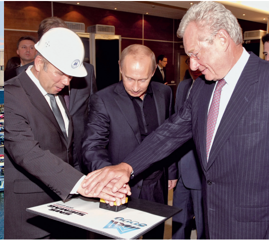
Das Krasnaja Presnja ist deutschen Exporteuren gut bekannt: Die Messe Düsseldorf veranstaltet hier – auf dem Gelände des Expocentr in Moskau – seit vielen Jahren ihre Ausstellungen. In diesem Jahr gibt es 14 Shows.