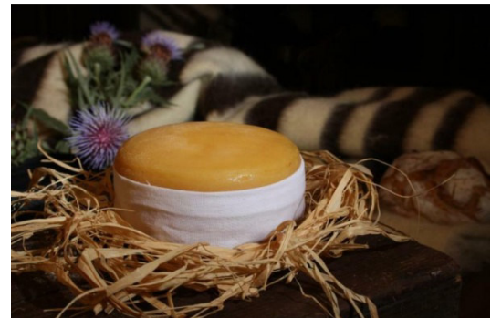
Queijo da Serra

Nach Einschätzung des Nationalverbands der Milchwirtschaft, ANILACT, wird es noch Jahre dauern, bis die Produktion des Queijo da Serra da Estrela wieder auf den Stand von vor den verheerenden Bränden vom 15. und 16. Oktober letzten Jahres kommt, denen auch rund 8.000 Schafe zum Opfer gefallen waren. Die Qualität des berühmten Schafskäses mit geschützter Ursprungsbezeichnung habe hingegen nicht gelitten. Derzeit richteten sich besondere Anstrengungen auf die Nachzucht und Verstärkung noch vorhandener Restherden der einheimischen und für die Sierra da Estrela typischen Rasse Bordaleira.