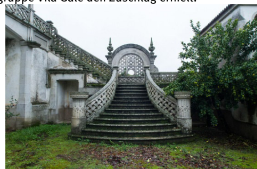
Casa de Marrocos

Im Rahmen des Revive -Programms, das darauf abzielt, öffentliche Gebäude von historischer und kultureller Bedeutung für touristische Zwecke nachhaltig zu sanieren und der Öffentlichkeit wieder zugänglich zu machen, stehen in Kürze drei weitere Ausschreibungen an. Neben dem Herrenhaus Casa de Marrocos in Idanha-a-Nova sind die ehemaligen Klöster Convento de São Francisco in Portalegre sowie Convento de Santo António dos Capuchos in Leiria zur Konzessionierung vorgesehen. Von den bisher sieben erfolgten Ausschreibungen konnte mit dem Gestüt Coudelaria de Alter bereits das vierte Verfahren abgeschlossen werden, für das die portugiesische Hotelgruppe Vila Galé den Zuschlag erhielt.