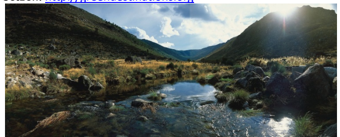
Serra da Estrela/Zentralportugal

Bei den Sustainable Top 100 Destination Awards, die am vergangenen 6. März auf der ITB in Berlin vergeben wurden, gewann Portugal in der Kategorie „Best of Europe“ einen der zehn begehrten Preise als beste grüne Destination Europas. Die von der Organisation Green Destinations verliehenen Awards sind eine Anerkennung für Reiseziele und Reiseveranstalter, die sich durch Innovation und vorbildliches Tourismusmanagement auszeichnen und auf Qualität, Attraktivität und Nachhaltigkeit im Tourismus setzen. http://greendestinations.org