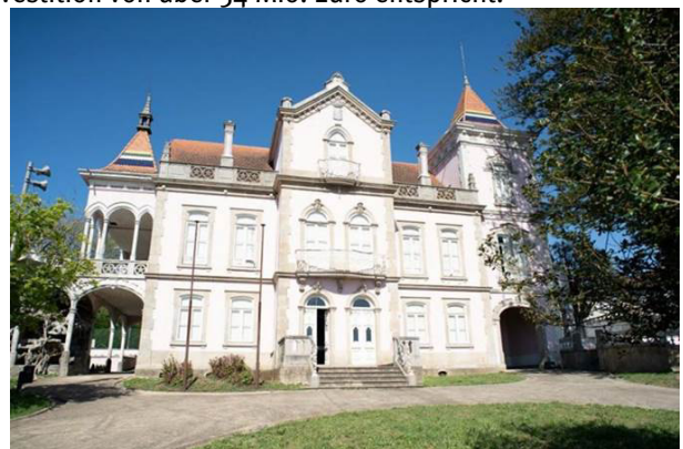
Palacete Conde Dias Garcia (S. João da Madeira)

Das erfolgreiche Programm Revive , welches ungenutzte historische Gebäude zur touristischen Nutzung ausschreibt, geht mit 15 neuen Objekten in die 2. Runde. Dazu zählen der Palast Viscondessa de Santiago do Lobão (Porto), das Kloster S. José (Évora), das Forte Velho do Outão (Setúbal), das Castelo de Almada, die Fortaleza da Torre Velha (Almada), das Forte da Cadaveira (Cascais) und der Palast Conde Dias Garcia (S. João da Madeira). Seit 2016 konnten bereits Ausschreibungen für 17 Objekte durchgeführt und sieben Konzessionen an Privatpersonen vergeben werden, was einer Investition von über 54 Mio. Euro entspricht.