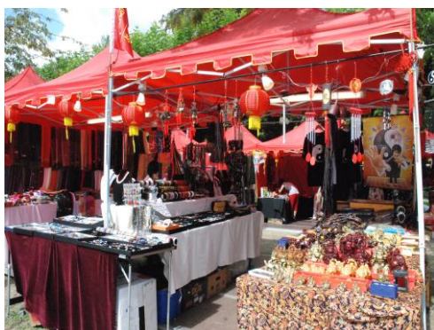
China-Markt auf dem Museumsuferfest in Frankfurt a.M. 2009.

durch und vermittelt zugleich wirtschaftliche und touristische Informationen über China.