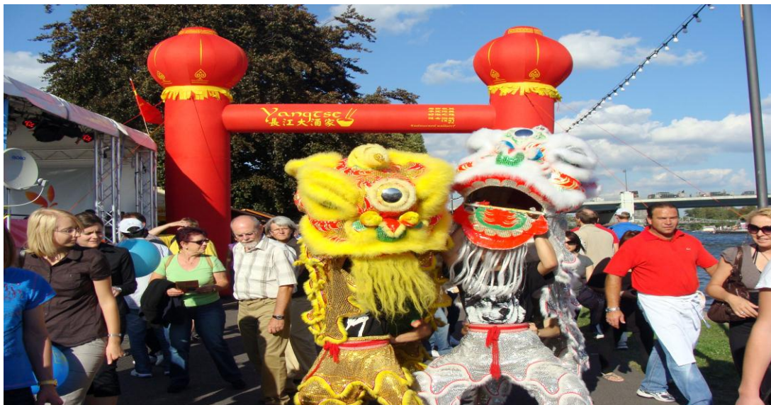
Szene: China-Markt am Main, 2009.

Die Bescheinigung für den China-Markt seitens der Stadt Frankfurt finden Sie anliegend.