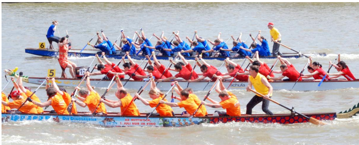
Szene: Drachenboot Festival in Frankfurt am Main, 2009.

Von Freitag, den 25. bis Sonntag, den 27. Mai 2012 findet das Drachenboot Festival am Main statt. Am Pfingstmontag, den 28. Mai wird ein vielfältiges Bühnenprogramm aufgeführt.