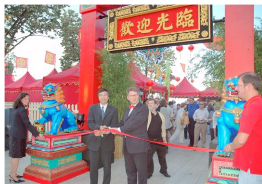
Zusammenarbeit mit Firma Roncalli für den "China-Markt" in Hamburg 2006.