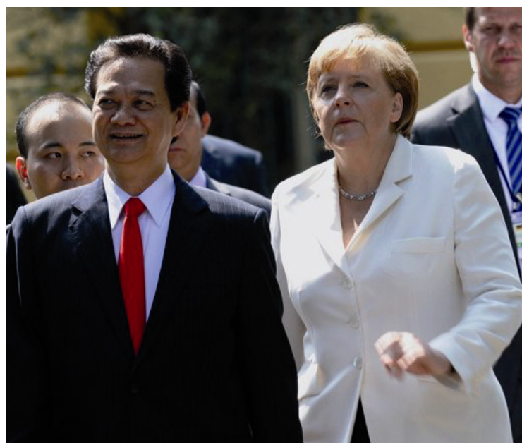
Nguyen Tam Dung, Premierminister der Sozialistischen Republik Vietnams, empfängt die Kanzlerin Angela Merkel am 11. Oktober 2011 in HCMC, Vietnam